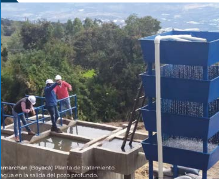
Sutamarchán (Boyacá) Planta de tratamiento de agua en la salida del pozo profundo.

Interventoría administrativa, financiera y técnica para la terminación y puesta en funcionamiento del Coliseo Arena Bogotá.